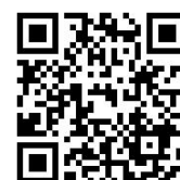
マッサージ方法の動画 はこちらから