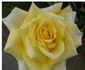
ゴールデンハート