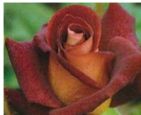
ブラックゴールド